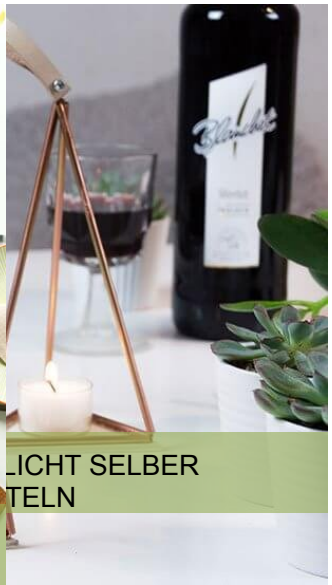
LICHT SELBER TELN