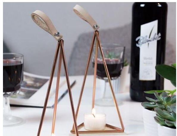
KUPFER TEELICHT SELBER BASTELN