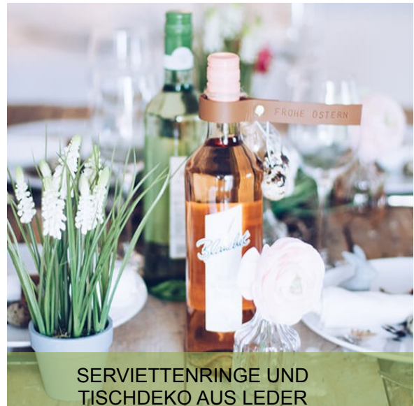
SERVIETTENRINGE UND TISCHDEKO AUS LEDER