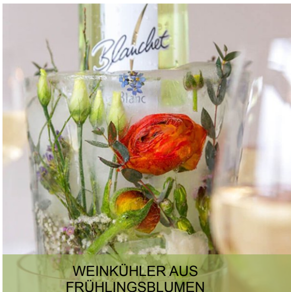
WEINKÜHLER AUS FRÜHLINGSBLUMEN

Diese Deko-Ideen könnten dir auch gefallen: