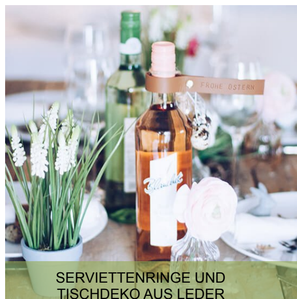
SERVIETTENRINGE UND TISCHDEKO AUS LEDER