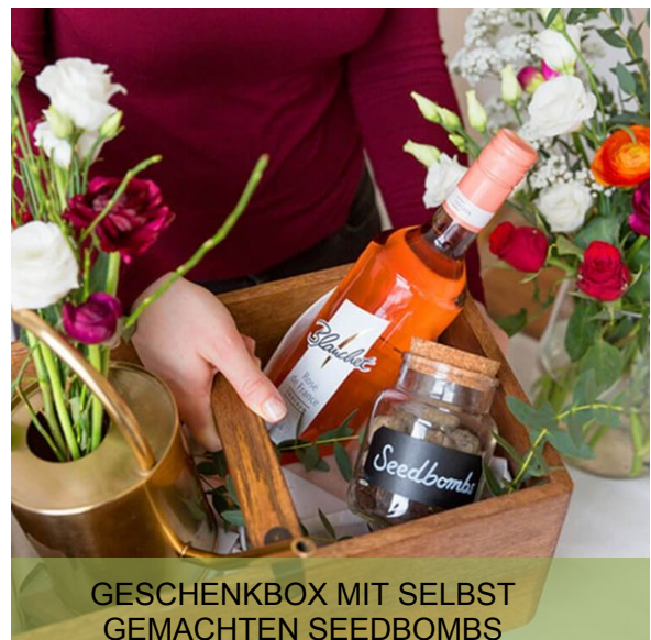
GESCHENKBOX MIT SELBST GEMachten SEEDBOMBS